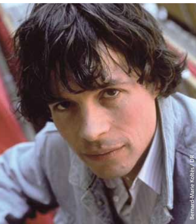
Bernard-Marie Koltès