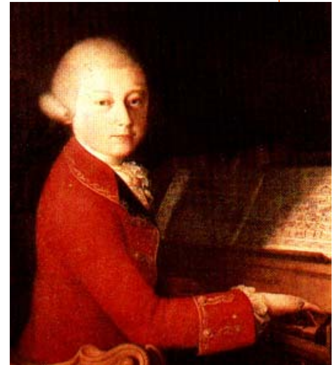
Wolfgang Amadeus Mozart

TALENT PRÉCOCE MAÎTRE DU CLAVIER VOYAGEUR INFATIGABLE COMPOSITEUR INSOLENT ARRANGEUR DÉRANGEANT IMPROVISATEUR DE GENIE